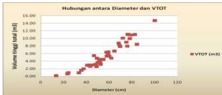
Gambar 3. Hubungan antara Diameter dan Volume Total

Dari grafik diatas dapat dilihat bahwa pohon Puspa dengan diameter 40-80 cm lebih banyak dibandingkan dengan kelompok diameter lainnya.