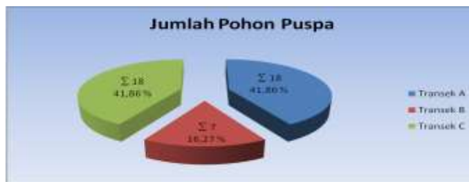
Gambar 1. Jumlah presentasi Pohon Puspa pada Plot Pengamatan

Pada transek A dan C ditemukan pohon Puspa masing-masing sebanyak 18 pohon Puspa sedangkan pada transek B hanya ditemukan 7 pohon Puspa sehingga total dari ketiga transek tersebut ditemukan 43 pohon. Untuk kehadiran jumlah individu pohon Puspa dapat dilihat pada Gambar 1 di bawah :