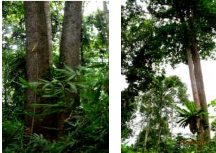
Gambar 4. Pohon Puspa ( Schima wallichii Korth) di KRUS

memiliki daya survive yang cukup tinggi dengan kulit kayu yang tebal sehingga tahan api, namun dikala roboh anakan akan cepat tumbuh disaat hujan turun membasahi lantai hutan (Anonim, 2014). Oleh sebab itu juga ada beberapa pohon puspa yang mengalami kerusakan pada tajuk dan batang akibat kebakaran.