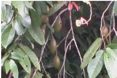
Gambar 5. Salah satu pohon induk ulin terpilih sebagai TBS yang sedang berbuah

Selanjutnya dari hasil penelitian ini dimana telah terpilihnya lokasi tegakan benih ulin terseleksi di dalam KHDTK Hutan Penelitian Samboja maka diharapkan kedepan lokasi tegakan benih terseleksi di KHDTK Hutan Penelitian Samboja ini dapat menjadi salah satu tempat sumber benih ulin berkualitas di Provinsi Kalimantan Timur. Sebagai rencana tindaklanjut pengelolaan kedepan terhadap tegakan benih ulin terseleksi ini ada beberapa rekomendasi kepada pihak pengelola KHDTK Hutan Penelitian Samboja dalam hal ini ditujukan kepada Balai Penelitian Teknologi Konservasi Sumber Daya Alam (Balitek KSDA).