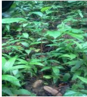
Gambar 4. Anak-anak ulin alami yang ditemukan di bawah pohon induknya