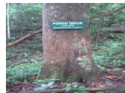
Gambar 3. Salah satu pohon induk ulin terpilih sebagai TBS di KHDTK Samboja

Adapun gambaran kondisi di lapangan yang menunjukkan salah satu kondisi pohon induk terpilih dan terseleksi, jumlah anakan di bawah pohon induk dan pohon induk yang sedang berbuah tersaji pada Gambar 3, 4 dan 5.