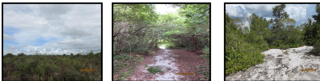
Gambar 2. Kondisi Lokasi Penelitian

Anggrek merpati putih lebih banyak ditemukan pada areal terbuka dan areal hutan yang pernah mengalami kebakaran. Anggrek ini banyak ditemukan di pulau 3 yang dulunya adalah pulau 4 karena mengalami kebakaran pada tahun 2014 pulau 4 hanya menyisakan sedikit vegetasi pohon, sekarang didominasi oleh alang-alang, kantong semar dan Anggrek merpati putih.