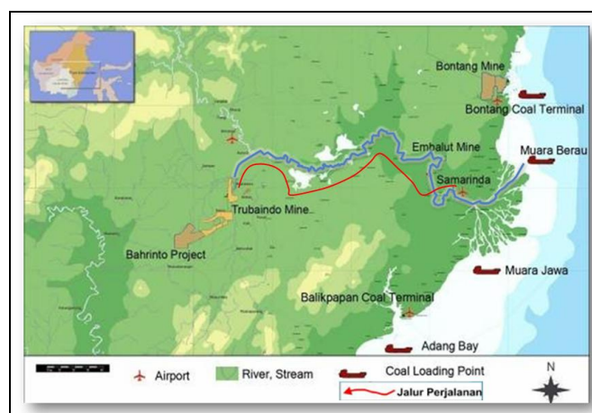
Gambar 1. Lokasi Kesampean Daerah Penelitian, Tanpa Skala.

51'30'' BT, 0 27'44'' – 0 51'41'' LS. PT Trubaindo Coal Mining memiliki perjanjian kontrak karya dengan pemerintah Indonesia, konsesi tambang batubara seluas kurang lebih 23,000 ha. Untuk mencapai lokasi penelitian tersebut dari Kota Samarinda menuju kantor PT TCM site Adong, Kecamatan Muara Lawa, Kabupaten Kutai Barat, dapat menempuh perjalanan darat menggunakan roda empat kurang lebih 8 jam.