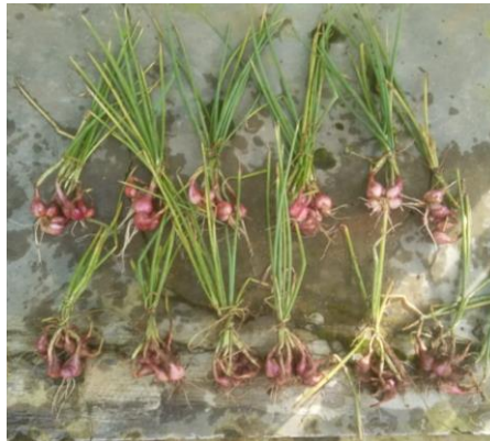
Gambar 4. Produksi Umbi Per Rumpun

Produksi umbi per rumpun (Gambar 4) tidak menunjukkan hasil yang signifikan dimana produksi umbi per rumpun pada kontrol (P 0 ) yaitu 36,50 gram sedangkan produksi umbi P 2 yaitu 38,67 gram, P 3 yaitu 40,83 gram, dan P 4 yaitu 34,50 gram. Penambahan pupuk tidak diikuti peningkatan produksi.