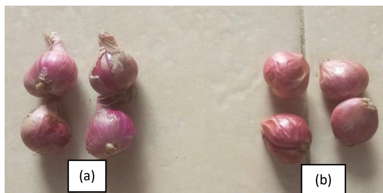
Gambar 3. Berat umbi (a) umbi dengan perlakuan NPK (kontrol) rata rata berat 6,5 gram (b) umbi sebagai benih ; rata rata berat 5 gram

pupuk MPK cair. Berat umbi pada perlakuan P 2 , P 3 , dan P 4 relatif sama. Diduga berat umbi berkorelasi dengan pertumbuhan tanaman. Sesuai dengan hasil penelitian Palupi dan Alfandi (2018) bahwa ada korelasi yang signifikan antara jumlah daun per rumpun dengan berat umbi kering.