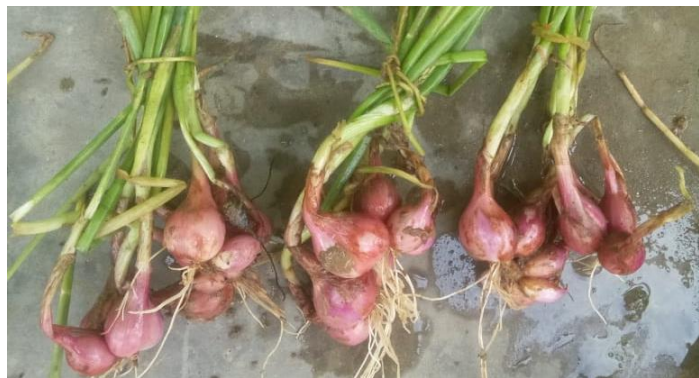
Gambar 2. Jumlah umbi 5 sd 11 butir

jenis tanah ultisol diperoleh jumlah anakan rata rata 6,03 buah. Hasil penelitian terhadap bobot umbi yang diberikan pupuk NPK mencapai 7-9 umbi. (Mehran, Kesumawaty, and Sufardi 2016). Berdasarkan jumlah umbi menunjukkan bahwa potensi bawang merah yang ditanam pada tanah ultisol di Kalimantan Timur cukup baik hasilnya. Hasil penelitian terhadap jumlah umbi hasil penelitian yang dilakukan pada tanah alfisol rata rata 6,4 buah sedangkan pada tanah vertisol 5,7 buah (Purnawanto and Budi 2008).