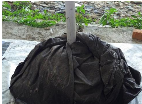
Gambar 2. Tumpukan Kompos Dengan Pipa Paralon Sebagai Sirkulasi Udara

d) Bahan yang telah tercampur diletakkan di atas tempat yang kering membentuk gundukan, kemudian diberi pipa paralon di atasnya untuk sirkulasi udara setelah itu gundukan bahan kompos ditutup dengan menggunakan terpal (Gambar 2).