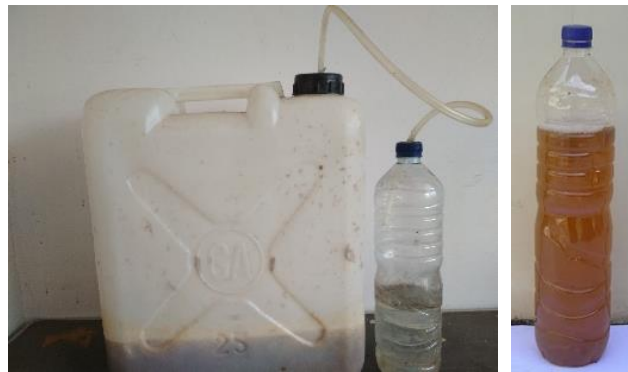
Gambar 2. Jerigen berisi bahan MOL dan MOL yang sudah jadi.

Sebelum dilakukan pengomposan, kirinyuh dipotong terlebih dahulu hingga mencapai ukuran 3-5 cm, lalu digiling dengan menggunakan mesin penggiling kompos. Setelah semua bahan-bahan kompos menjadi halus, bahan-bahan tersebut dicampur di atas terpal yang telah disediakan.