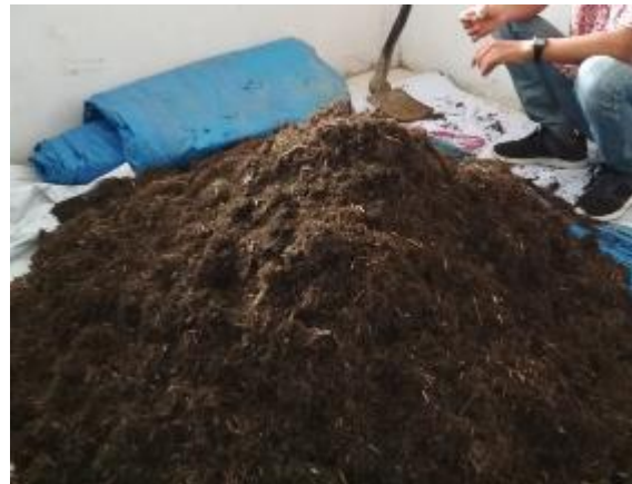
Gambar 4. Tumbuhan kirinyuh dan bahan kompos yang telah diaduk rata.