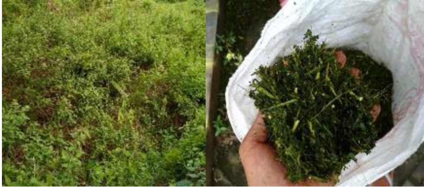
Gambar 3. Bahan Utama Pembuatan Kompos (Tumbuhan Kirinyuh).