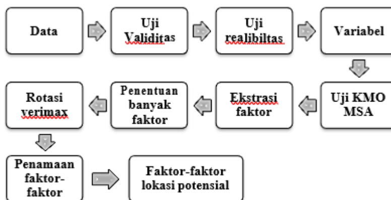
Gambar 2. Tahapan Analisis Faktor

Analisis faktor dipergunakan dengan tujuan untuk menyederhanakan beberapa variabel yang diteliti menjadi sejumlah faktor yang lebih sedikit dari jumlah variabel yang diteliti