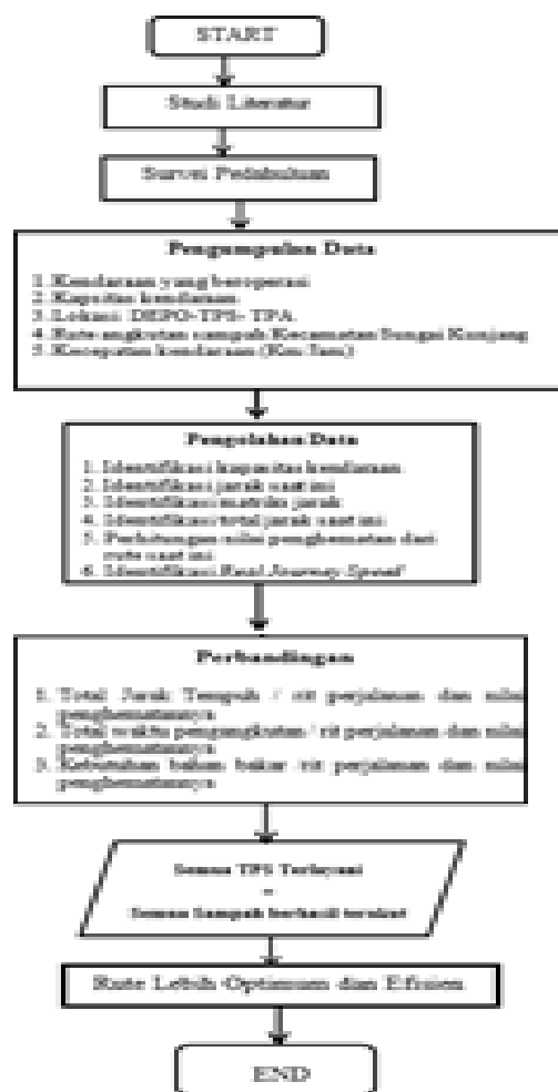
Gambar 3. Diagram alur penelitian